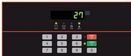
Control Quantum™ Gold